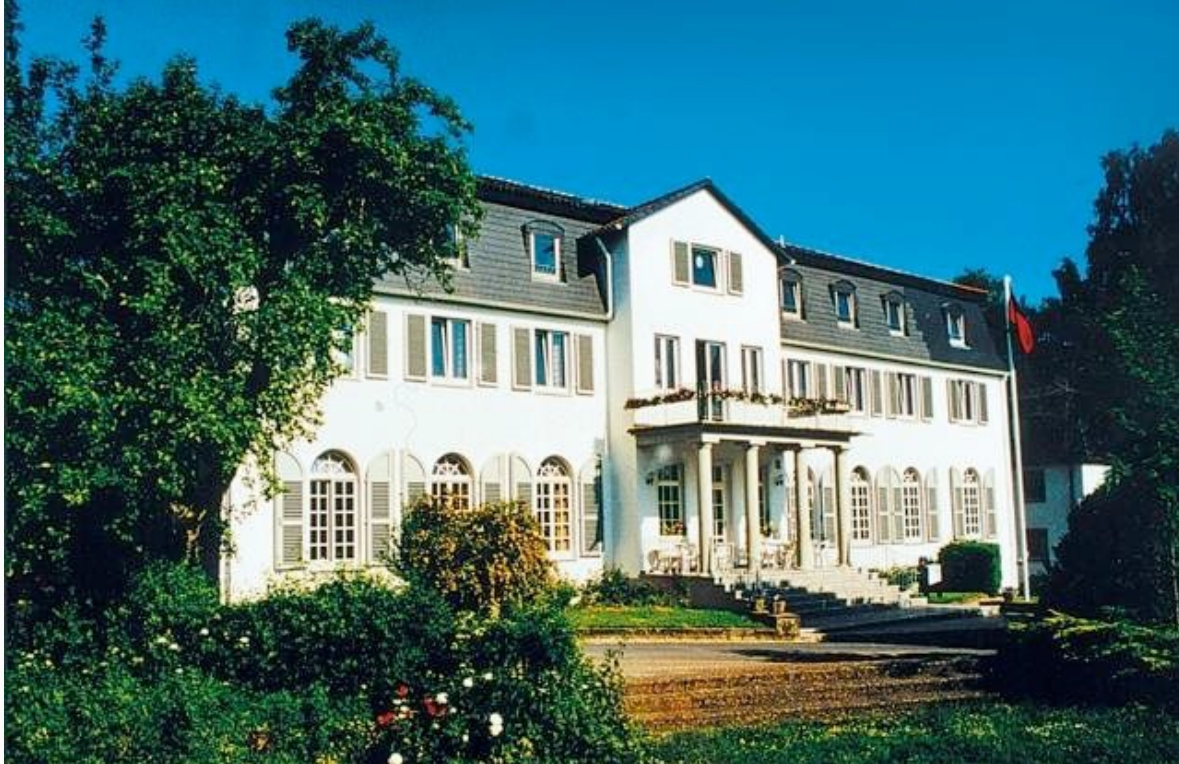
Bildungsstätte und Jugendherberge „Der Heiligenhof“ Alte Euerdorfer Str. 1, 97688 Bad Kissingen